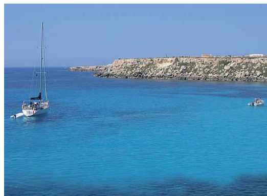
FAVIGNANA - ANCORAGGIO A FAVIGNANA