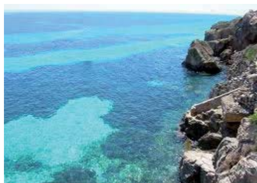
MARETTIMO - CALA MARINAIO