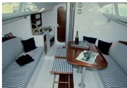
DINETTE DI AQUARANTA