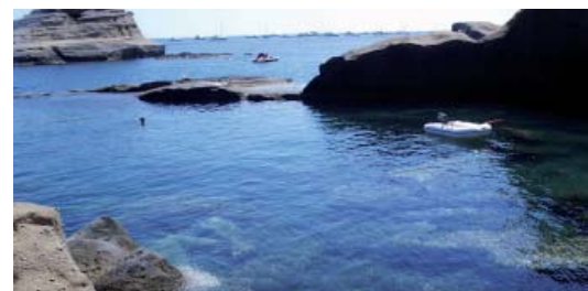
UNA CALETTA A VENTOTENE