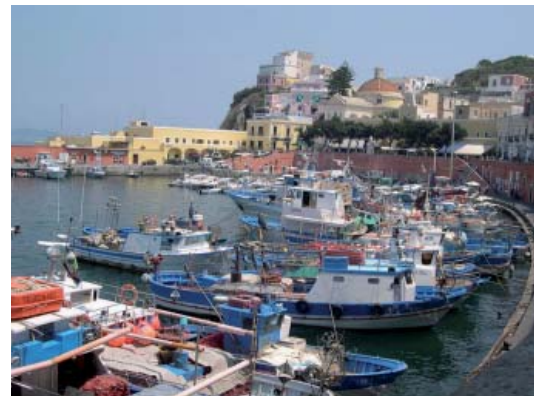
CARATTERISTICO PORTO DI PONZA