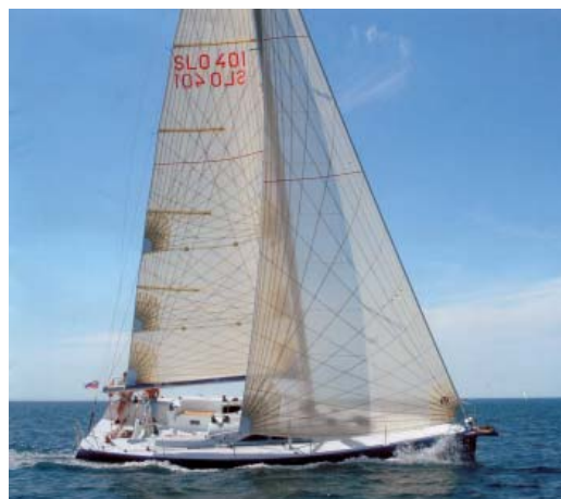
AQUARANTA IN NAVIGAZIONE

Il programma originario potrebbe subire delle variazioni in funzione delle condizioni meteo e comunque a discrezione dell'Istruttore.