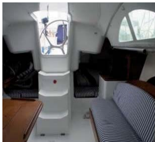
LE CABINE DI POPPA